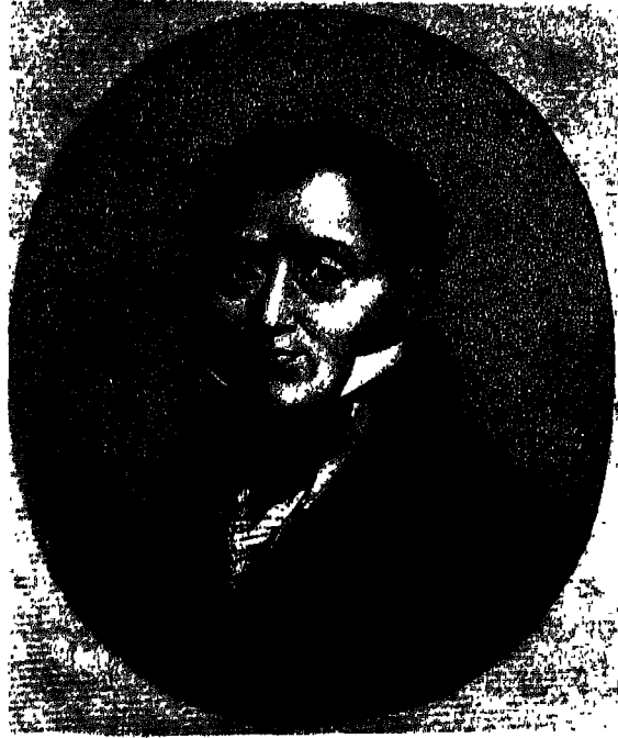
الكونت دو لاس كاسس .

ولحسن الحظ جاءت هذه المخابرة الهاتفية من كليفوردي فري، «فالحصار الفرنسي» لم يعد فعلاً.